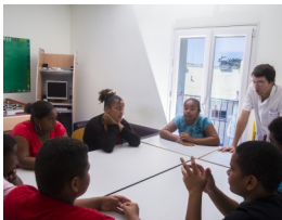
Des séances collectives

4 L' évaluation : un bilan régulier pour faire le point